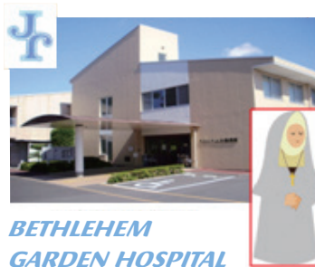
BETHLEHEM GARDEN HOSPITAL

一方、自宅のブンタンはまさに青春時代で、生き生きとした青葉が日の光にまぶしいほどです。