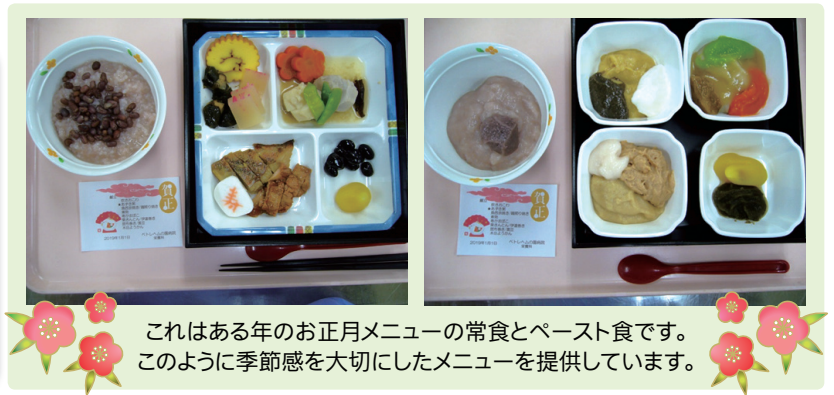
これはある年のお正月メニューの常食とペースト食です。このように季節感を大切にメニューを提供しています。